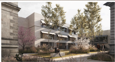
Neubau eines Servicegebäudes für die Herzog August Bibliothek in Wolfenbüttel 2021