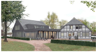
Erweiterung und Sanierung Rathaus Sottrum 2022-2023