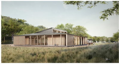
Neubau Schulmensa Clausthal-Zellerfeld 2024